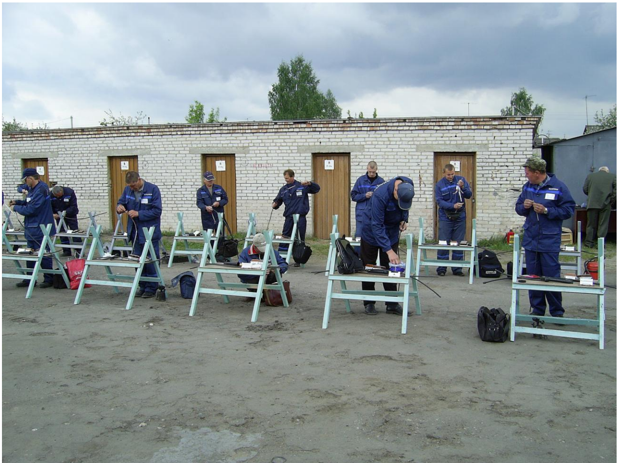
Конкурс профессионального мастерства среди кабельщиков-спайщиков Минского филиала РУП «Белтелком»