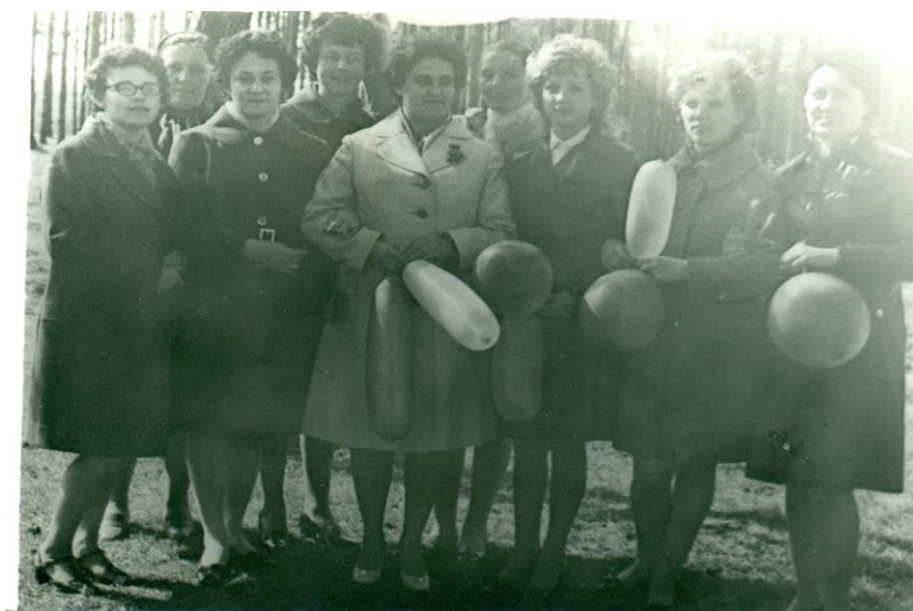
Коллектив узла связи на первомайской демонстрации