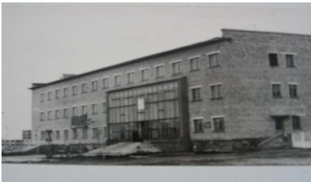
Здание узла связи 1965 год по ул.Козлова