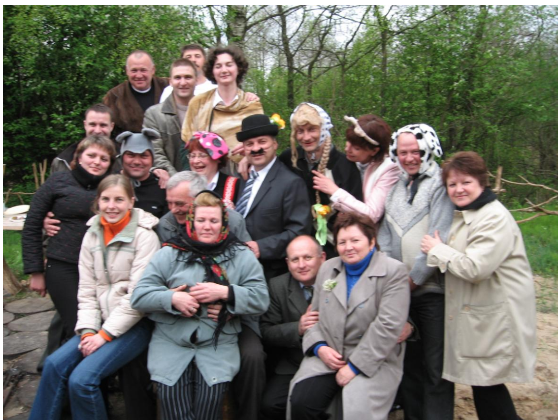
Отдых коллектива узла связи на природе. После постановки спектакля «Репка»