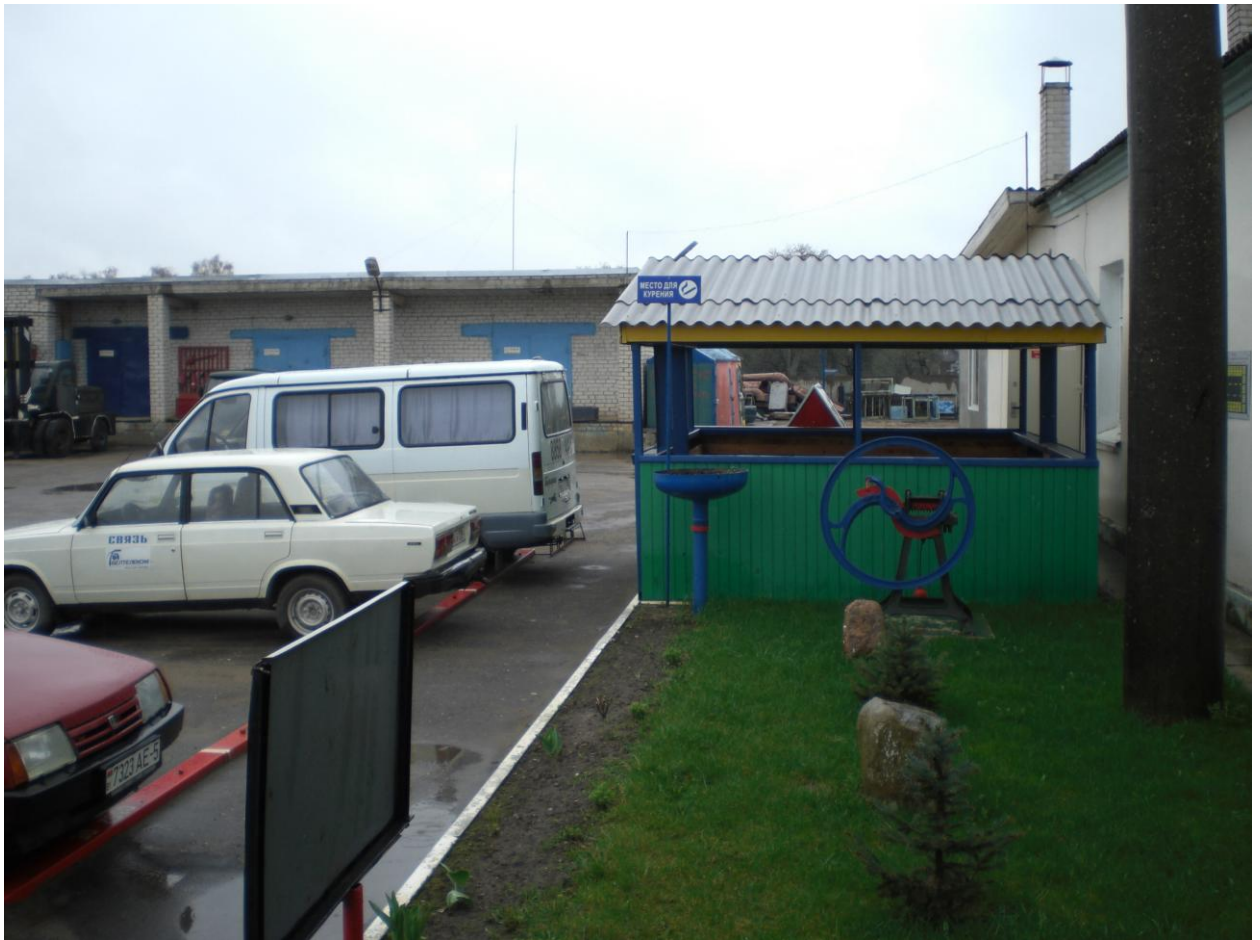
Территория транспортного участка