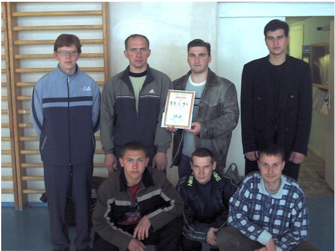
Команда по мини-футболу Солигорского РУЭС.