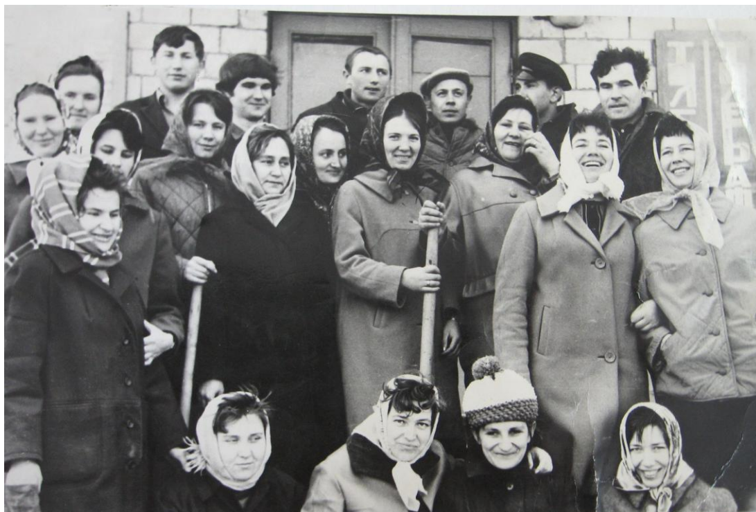
Коллектив узла связи на субботнике, апрель 1971 года