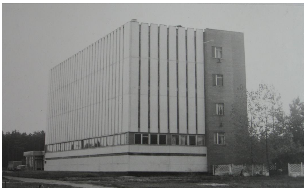
Вновь построенное здание узла связи пр.Мира, 40 1982 год